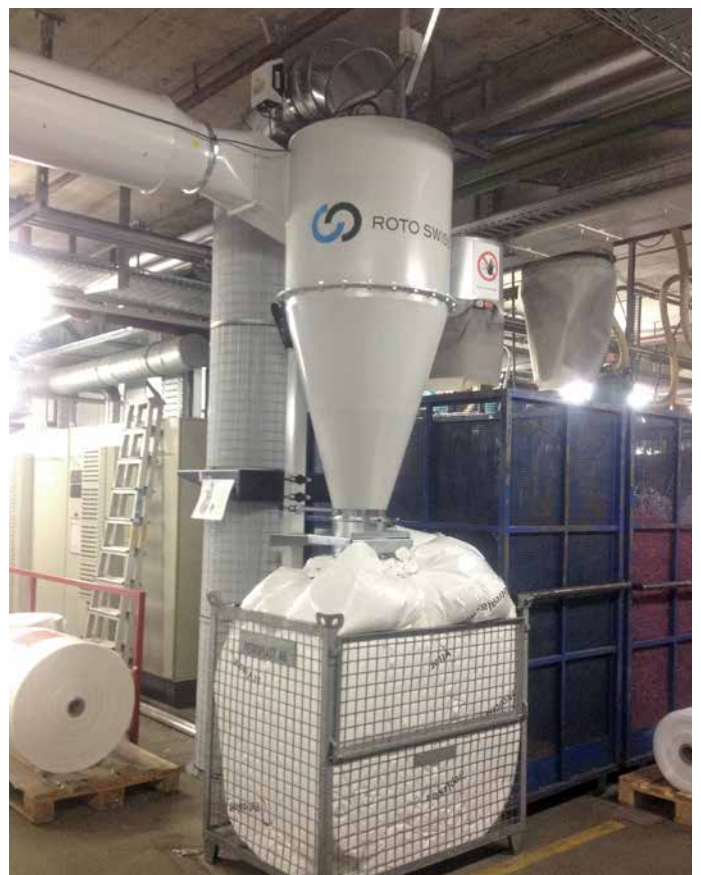
Zyklon 750 mit Ionisationsrohr und Filter Cyclon 750 with iontube and filter