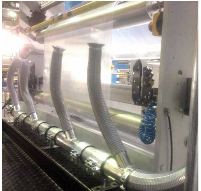
Erfassung Flexsystem an Reifenhäuser Collection flexsystem on Reifenhäuser