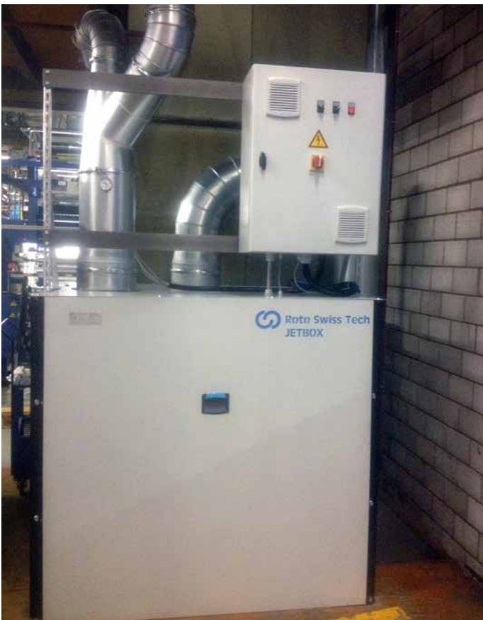
Jetbox 2000 mit Steuerschrank Jetbox 2000 with control