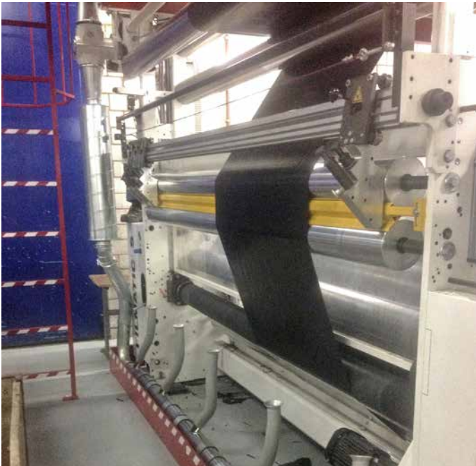
Erfassung mit Cutter an Windmöller & Hölscher Collection with Cutter on Windmöller & Hölscher