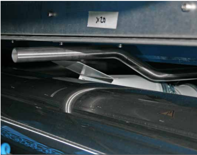
Erfassung mit Handhebel Collection point with support