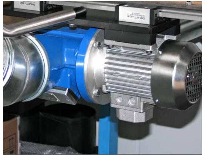
Cutter RC 140 auf Linearführung Cutter RC 140 on linear guide