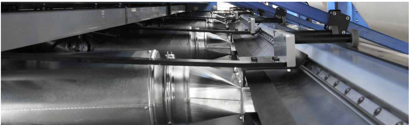
Saugschlitzkanal 6000 mm Suction channel 6000 mm