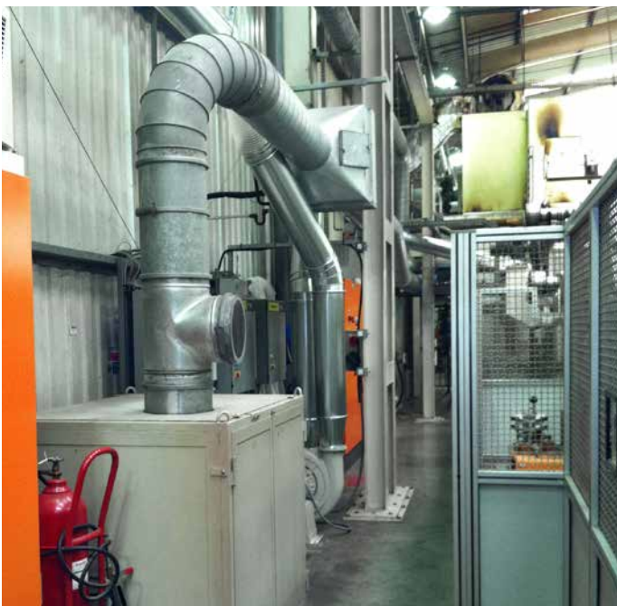
Gebläse 15 KW mit Rohrleitung Blower 15 KW with piping