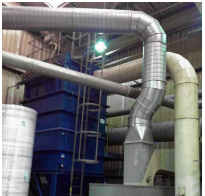
Filtersystem Kunde Existing filtersystem customer