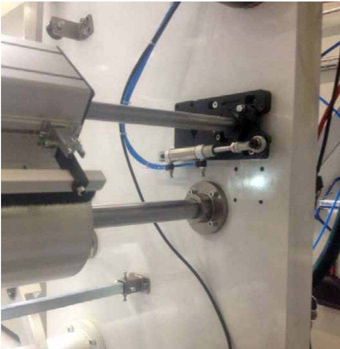
Montageplatte mit Schwenkzylinder Mounting plate with swivel cylinder