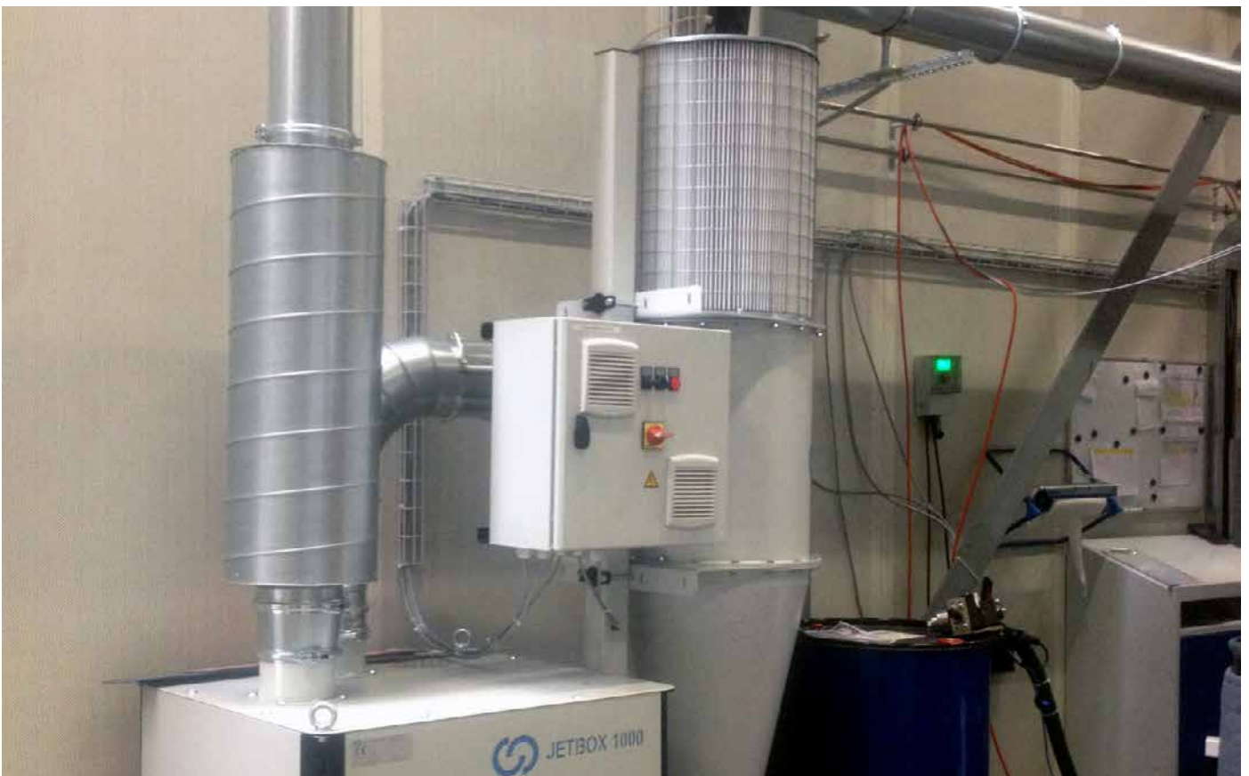
Gebläsebox, Steuerung und Zyklonabscheider Blow box, control and cyclone separator