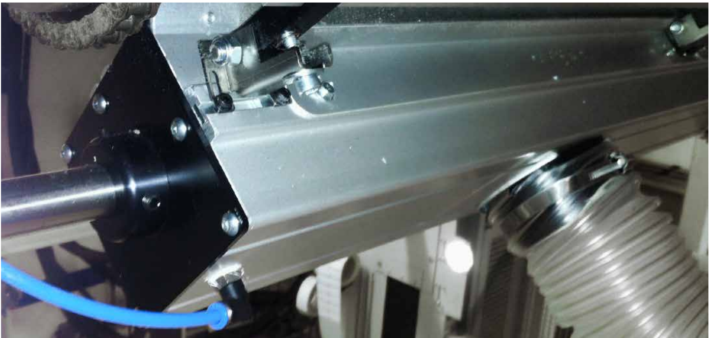
Jetclean mit Leitwalzen und Bahneinzug Jetclean with guiding roller an chane feeder