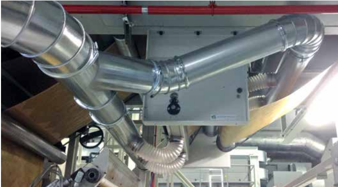
Rohrleitung zu den Absaugpunkten Pipe system to the suction points