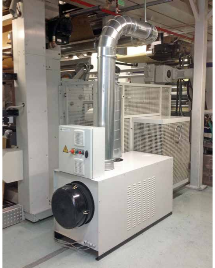
Filterbox 2400 mit Steuerung Filterbox with control unit